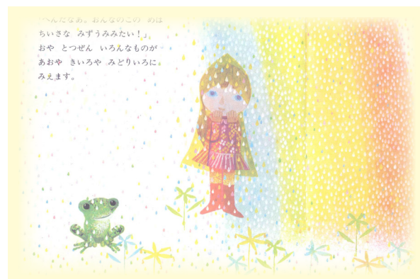
『おんなのことあめ』より

嫌な雨も視点を変えればたくさんの良いところがあります。輝く雨粒や、カエルなどの動植物にとっては恵みとなる雨。絵本『おんなのことあめ』は、灰色で描かれがちな雨を 7 色の雨粒で描いた息をのむ程美しい絵本です。雨そのものを好きになれば、1 日楽しい気持ちで過ごすことが出来ます。