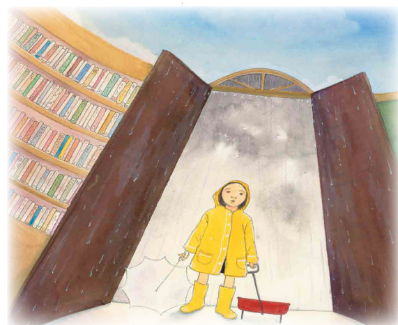
『ほんをひらいて』より

「子どもにいろんなことを経験させてあげたい」と計画していたのに、遠出が出来なくなってしまった。そんな時、図書館は新しい世界に出会える場所です。興味のある本を選んで開けば、新しい世界が広がります。絵本『ほんをひらいて』には、黄色いレインコートを着て図書館に行く女の子が描かれています。暗い気持ちになりがちな雨の日も、図書館に行けば気持ちも明るくなります。